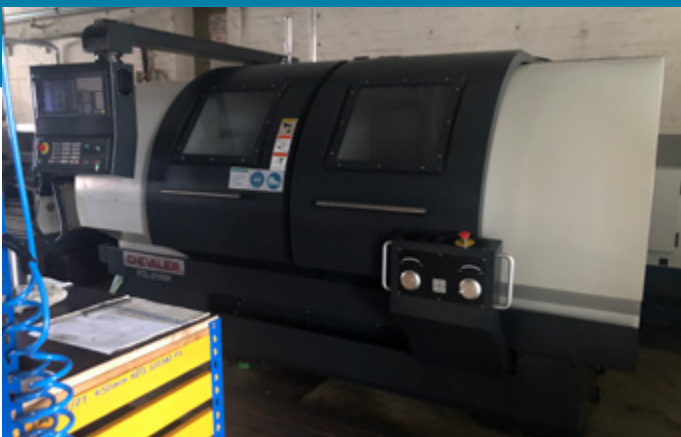
Die neue effiziente Zyklen-Drehmaschine spart 7 MWh an Energie.

Im Zuge der Fördermaßnahmen wurden einige Investitionen in verbesserte Energieeffizienz umgesetzt. Der Einsatz neuer LED-Beleuchtung erbringt eine Einsparung von 7,5 MWh bzw. 2,7 Tonnen CO 2 . Durch die Ersatzinvestition in eine neue Drehbank können 7 MWh und 2,6 Tonnen CO 2 pro Jahr eingespart werden. Eine neue Fräsmaschine spart noch einmal 3,0 MWh bzw. 1,1 Tonnen CO 2 jedes Jahr.