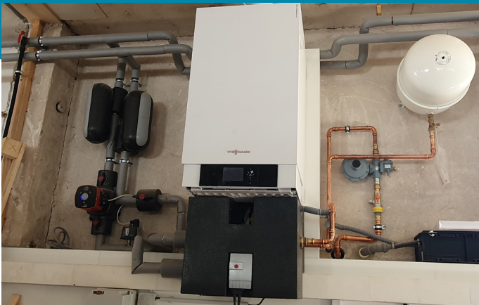
Moderne Brennwerttechnik spart 35 MWh.

Im Rahmen des Förderprojektes wurden verschiedene Maßnahmen umgesetzt. Der Einsatz von LED-Beleuchtung bringt eine Einsparung von 3 MWh und 1,28 Tonnen CO 2 . Rund 35 MWh und 9,2 Tonnen CO 2 werden durch die vollständige Umstellung der Wärmeversorgung auf ein Brennwertgerät gespart. Ein isoliertes Rolltor spart weitere 0,05 MWh sowie 0,02 Tonnen CO 2 . Demnach beträgt die jährliche Energieeinsparung rund 38 MWh und es werden fast 11 Tonnen CO 2 vermieden.